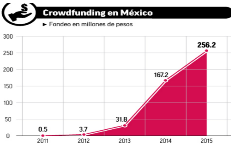
Tabla 5. Crowdfunding en México, Fondo en millones.